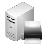
Print output management